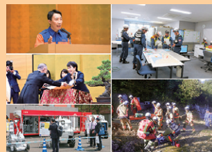
■ 表紙 本号掲載記事より